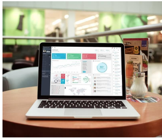
Administración en Web