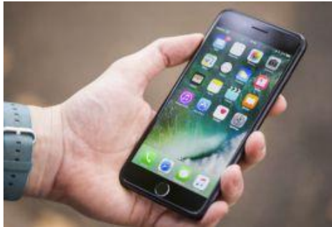
App móvil para el cliente