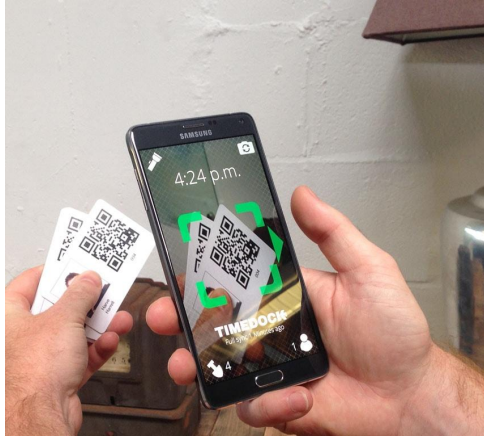
App móvil para empleados